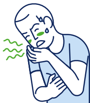
Vertiges / Nausées