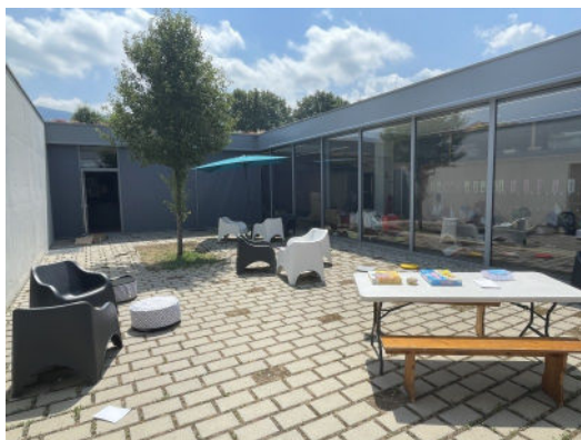
Aménagement du patio de l'école : création d'un espace de détente après le repas.