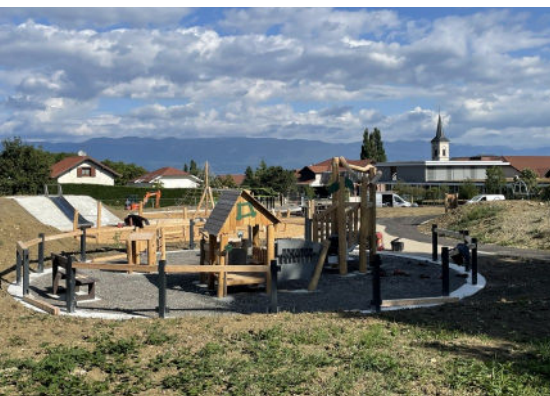
Ouverture du Parc de la Tulipe. Les plantations seront faites à l'automne. Inauguration le 29/08.