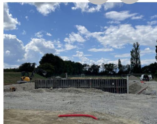
Construction du CTM : les travaux avancent.