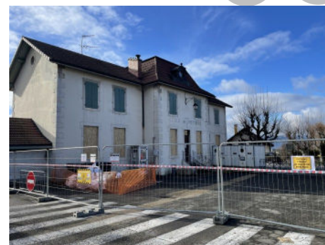
Début des travaux de désamiantage et déplombage de la future Mairie.