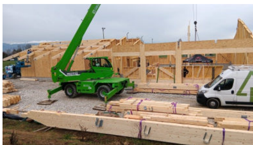
Construction du CTM : les travaux se poursuivent.