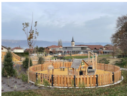
Plantations du Parc de la Tulipe réalisées fin novembre.